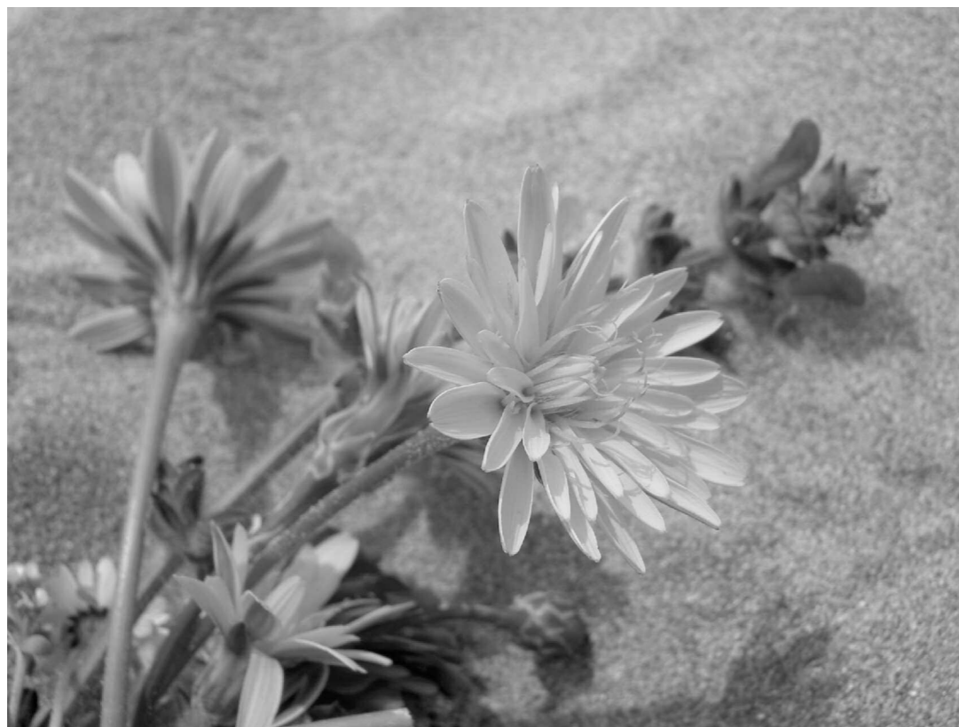
Grau d'iconicitat alt

Feu una interpretació personal de la fotografia adjunta disminuint el grau d'iconicitat a un grau mig o a un grau baix. Vegeu informació de suport*